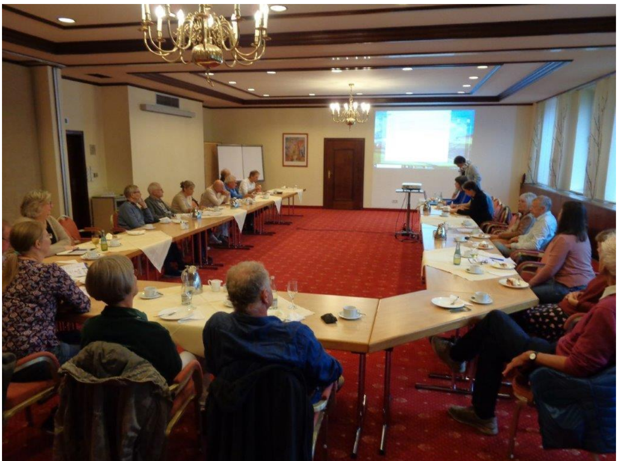
Jahresversammlung der BSH in Barnstorf

Die Aktivitäten umfassen alle Lebensräume im Kreisgebiet, was nach den Worten Kanzelmeiers eine gute Vorplanung und Koordination der Stiftung, ihrer Planer und einzelnen Akteure erfordert. Das wurde mit Beispielen überzeugend vorgestellt. Einzelheiten sind auch der Homepage der Stiftung zu entnehmen unter dem Link: https://www.stiftung-naturschutz-diepholz.de